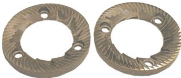
Garnitur MAHLSCHEIBEN SM 90 und SM 90/A 0900011R SM 95 und SM 95/A 500701/D