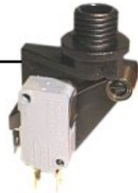
0906200/A Mikroschalter Trichter