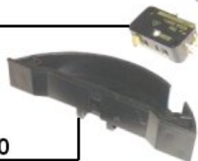
0906070 Gehäuse für Mikroschalter oben