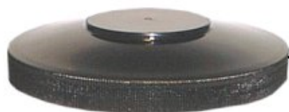
0906091 Portionierkammerdeckel Ø innen 120 mm