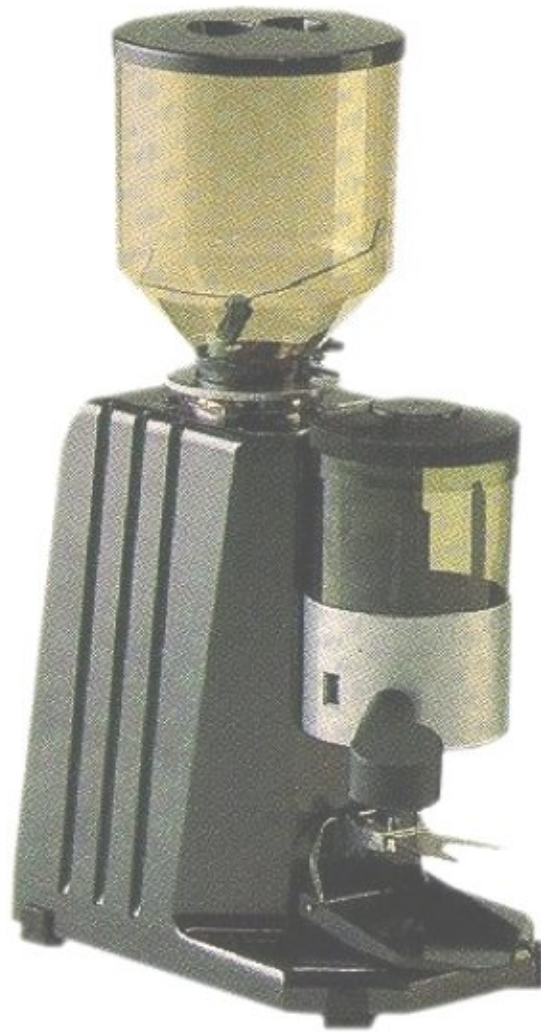
Kaffeemühle LA SAN MARCO SM 90/95